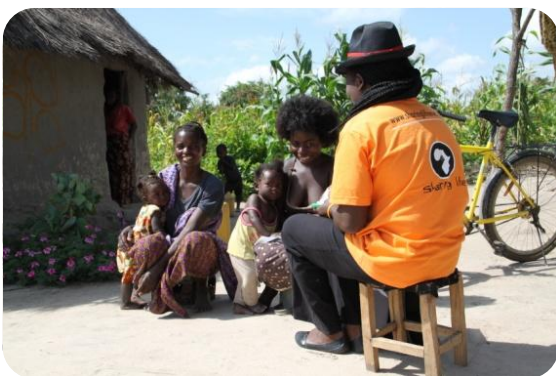
Due dei nostri Field Angels nei villaggi, mentre compilano il questionario del censimento insieme alle famiglie locali

Il censimento è durato poco più di due mesi ed è stato condotto interamente da ragazzi provenienti dai villaggi locali, dopo essere stati debitamente formati e forniti di materiale informativo e divulgativo. I ragazzi avevano un questionario, ed oltre a richiedere informazioni anagrafiche su ciascun nucleo familiare hanno svolto un'analisi di bisogno atta alla definizione di una scala di priorità destinata ad influire sui progetti pianificati da Sharing Life nell'area. Lo scopo del censimento è stato quello di isolare il target del programma medico della Ong, ossia uomini e donne tra i 14 e i 49 anni.