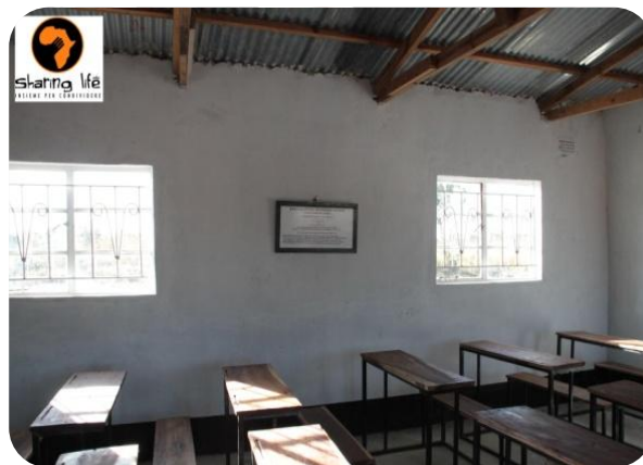
Aula vuota con nuovi banchi