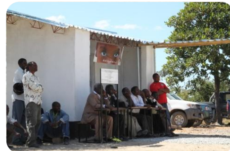
Bagni con veranda e doccette (durante inaugurazione)