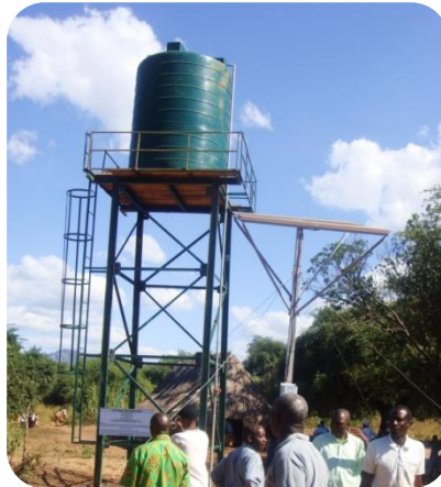
Pozzo con cisterna e 6 pannelli solari installati