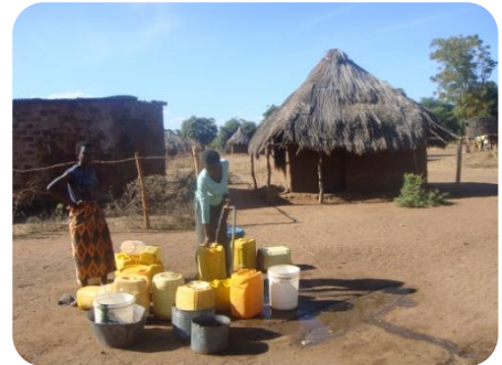
Uno dei 24 rubinetti installati nel villaggio di Kavalamanja