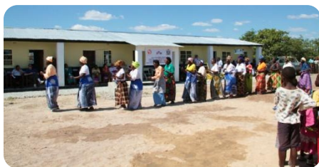
Cerimonia di inaugurazione di fronte la scuola materna

La scuola materna è stata inaugurata il 14 maggio 2011, con una cerimonia svoltasi al cospetto del Nunzio Apostolico, del rappresentante distrettuale del Ministero dell'Educazione, dei capovillaggio di Mayota, Katete e Kalimasenga, dei rappresentanti della comunità, del preside della scuola di Kamaila e di altri rappresentanti di Donatori internazionali. Sharing Life è riuscita poi ad ottenere dall'azienda zambiana Zambikes, una donazione consistente in una fornitura di biciclette per gli insegnanti che prenderanno servizio nella scuola materna, e che provenienti dal villaggio di Kamaila (in attesa che vengano costruite delle abitazione per loro e le loro famiglie) percorreranno quotidianamente la distanza tra la collina di Kamaila e il villaggio di Mayota. Entro la fine di settembre, è previsto l'avvio delle lezioni per circa 150 bambini del villaggio.