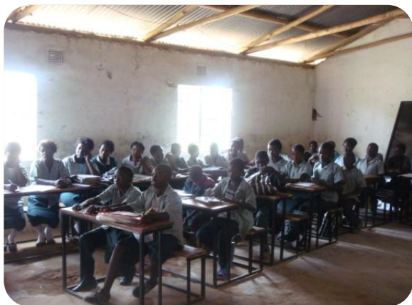
Ragazzi della Kamaila Upper Basic School mentre seguono le lezioni dai nuovi banchi donati

Sharing Life ha donato 28 nuovi banchi alla scuola di Kamaila, che hanno trovato posto nelle aule già in precedenza riabitate. Completamento progetto: anche le altre due aule necessitano di nuovi banchi. L'arredamento è fatiscente, e nuove case per insegnanti potrebbero essere costruite.