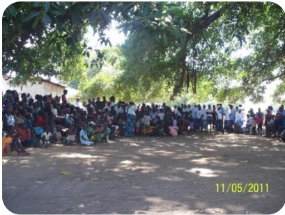
Abitanti del villaggio di Kavalamanja durante inaugurazione

idrico di approvvigionamento della lunghezza di svariati chilometri consente anche la disponibilità d'acqua in edifici esistenti e di prossimo completamento (Sharing Life si propone di costruire a Kavalamanja una scuola materna, nuovi bagni e completare le case per insegnanti). La pompa è alimentata da 6 pannelli solari in grado di produrre l'energia con cui l'acqua viene stoccata e poi raggiunge: la nuova abitazione per insegnanti, la clinica, altre costruzioni esistenti (come la l'abitazione del medico), costruzioni di futura costruzione (come i bagni per la comunità). In totale esistono ora 24 rubinetti, uno dei quali alimenterà un abbeveratoio per animali, così che animale e padrone non rischiano la vita avvicinandosi alle acque del fiume Zambesi infestate da coccodrilli e animali selvatici. L'inaugurazione a Kavalamanja ha preceduto di qualche giorno quella della scuola materna di Mayota, e ha visto la più ampia partecipazione delle autorità locali.